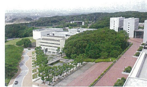
▲中央大学多摩キャンパス